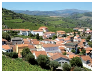
PAISAGEM RURAL DO DOURO VINHATEIRO