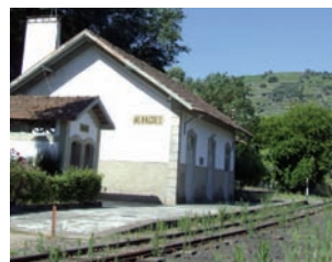
ESTAÇÃO DE ALVAÇÕES LINHA DO CORGO