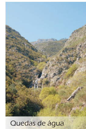
Quedas de água

fundo de elevada beleza, característico desta singular região - o Douro Vinhateiro. Pelos ecos e sons emanados pela natureza, há sempre um som mais alto que se destaca, o piar das aves de rapina que por aqui vão vagueando à procura de um pequeno roedor ou de uma lagartixa distraídos pela vida. Chegados ao lugar de Soutelo, vamos de encontro ao local onde teve início este percurso pelo território mais elevado do Concelho de Santa Marta de Penaguião.