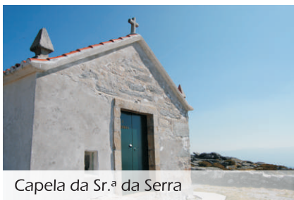
Capela da Sr. a da Serra

deslumbrando-nos com a ampla paisagem que nos rodeia, espera-nos uma extensa descida até ao lugar de Soutelo. Passando por entre ribeiros, pinhais e paisagens intensas com desniveis acentuados, podemos avistar os típicos vinhedos em socalcos, formando um o pano de