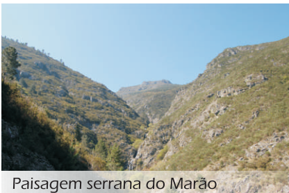
Paisagem serrana do Marão

O Trilho da Sr. a da Serra trata-se de um percurso pedestre de Pequena Rota (PR) marcado e sinalizado de acordo com as directrizes europeias e nacionais. Este